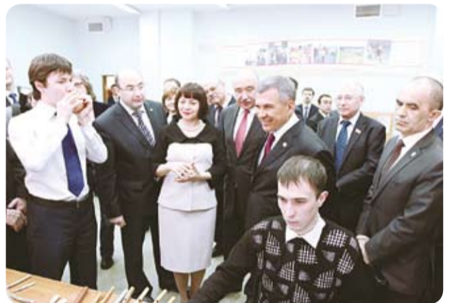
■ Кунаклар сәнгать бүлгә студентлары яна табып алып кайткан татар музыка уен кораллары белән таныша.