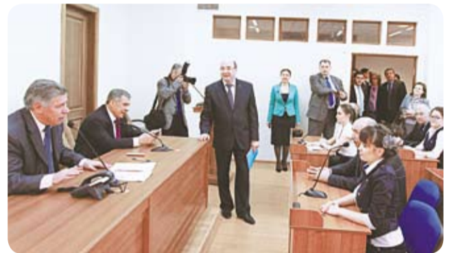
■ Он-лайн дәрестә.