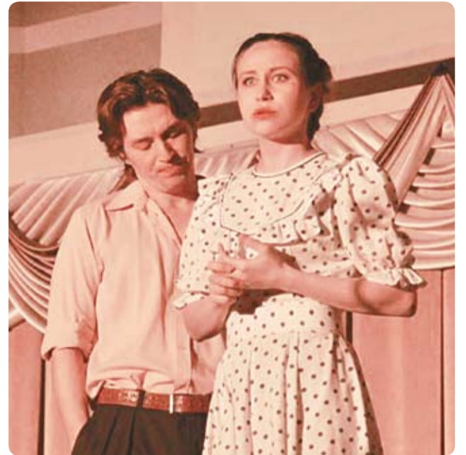
«Гашыйклар тавы» драмасыннан өзек.

«Миләүшә» исемле жьен-тыгына тупланган поэмалары һәм балладалары өчен, шагыйрьләрдән беренче буларак, Татарстан яшьләре оешмасының М.Жәлил ис. Республика премиясенә, «Таш диварлар авазы» һәм «Өзелмәс кыллар» исемле поэмалары өчен 1980 елда Татарстанның иң дәрәжәле бүләгенә – Г.Тукай ис. Дәүләт премиясенә лаек була. 1979 елда Россия Федерациясенә атказанган сөнгать эшлеклесе дигән мактаулы исемнәр ала. 1986 елда «Почет билгесе» ордены белән бүләкләнә.