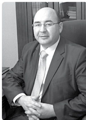
Дөнья һәм Россия күләмендә рус теле, әдәбияты укытучыларының үз Ассоциациясе бар. Татар теле укытучыларының да үз ассоциациясен булдыру мөһим. Бу турыдагы тәкъдимнәр дә игътибарга лаек дип саныйбыз.