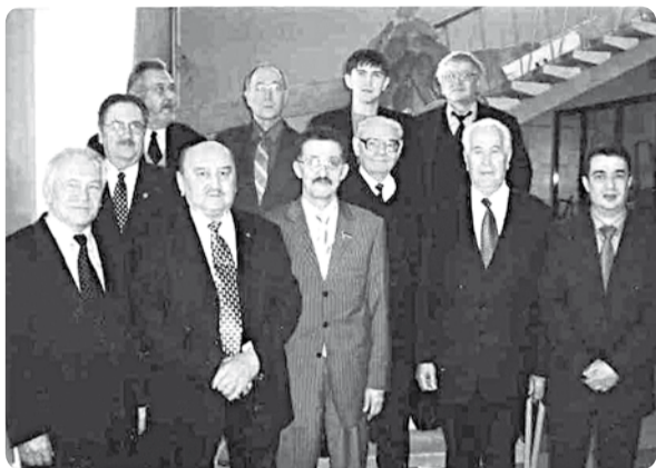
■ Мөхтәрәм галимнәр арасында