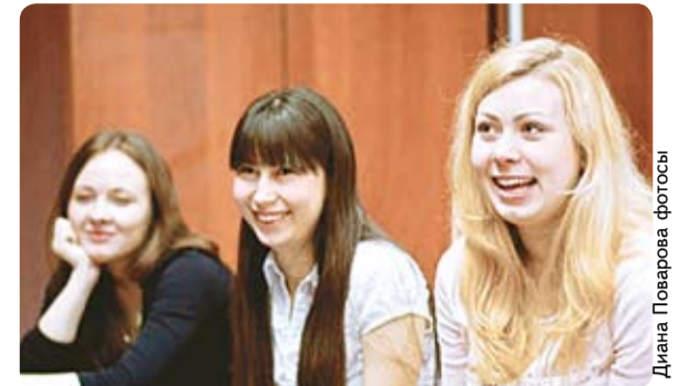
Дачна Попова фотосы

ка һәм механика, А.М. Бутлеров ис. Химия институтларынан да студентлар катнашты. Моның төп сәбәбе: «Шлюмберже» компаниясе хезмәт урынына геологлардан тыш, барлык югары техник белемле булган белгечләрне дә ала. Әлеге оешмага эшкә урнашасы килгән кеше