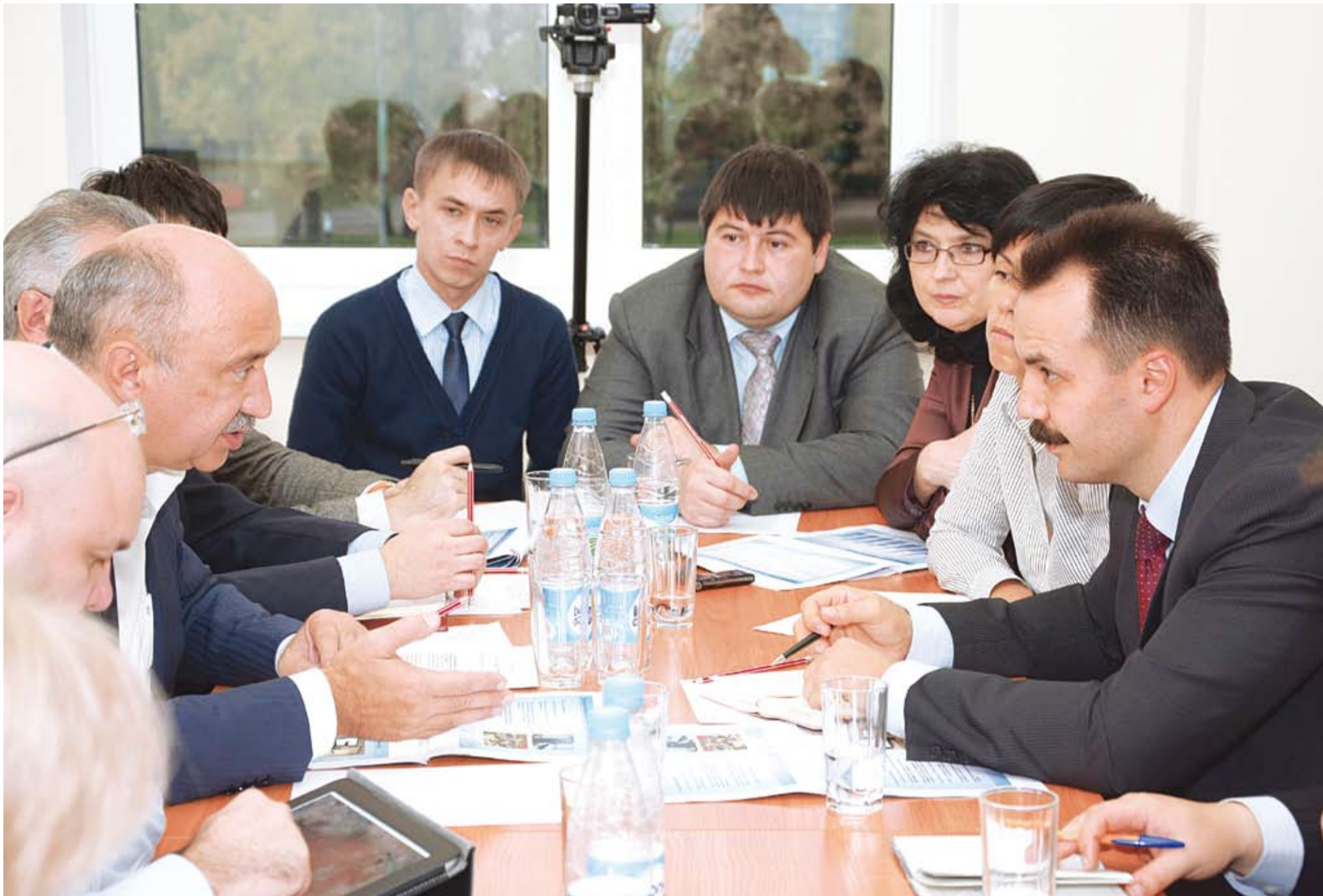
Влад. Михневский фотолары