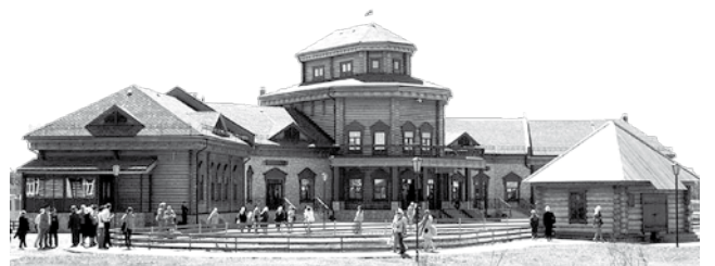
Икмәк музейе. Болгар.

һәм мәдәни мирас буларак бик әһәмиятле объект. ТР Дәүләт Киңәшчесе, «Янарыш» фонды житәкчесе Минтимер Шәймиев, бай тарихи мирасыбызны саклап калу, аны чытты яшәүче милләттәшләребез, дин кардәшләребезгә якынайту өчен, бик изге эшләр башкара. Экскурсоводыбыз да әлеге мәсьәләгә аерым басым ясады: «Без Ирек статуясын да, Эйфель манарасын да, Төркия, Италияләрен дә яхшы беләбез. Үзәбездәге кыйммәтләрен күрмәбез, аларның тарихын өйрәнмәбез, сакламыйбыз. Яшь буын рухи кыйммәтләрен күрәргә булуын күрәргә мөмкин.