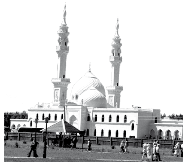
Ак мечет. Болгар.

Болгар тыюлыгы – федераль дәрәжәдә Татарстан Республикасы өчен тарихи