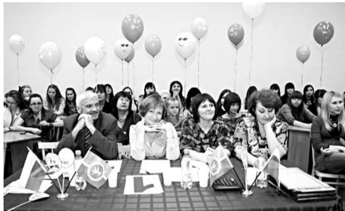
Рәсемдә: КВНчыларны бәяләүче жюри һәм жанатар-тамашачылар

Сөйләмне коррекцияләү процессы ата-анадан да, якыннардан да, баланың үзненнән дә зур көч һәм сабырлык таләп итә. Ләкин шул авыр һәм катлаулы юл киләчәктә зур уңышка илтергә мөмкин, чөнки бу эш белән иң тәҗрибәле кешеләр – укытучы-логопедлар шөгыльләнә!