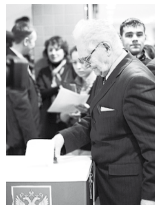
мәттәшлекләренә дә басым ясалды, гомумән, вузның хәзерге торыш картинасы ачылды.

Конференция ахырында санау комиссиясе сайлау нәтижеләре белән таныштырды. Гыйльми совет әгъзалары сайланган дип игълан ителде.