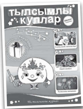
Башы 1нче биттә.

Бик аз вакыт эчендә шактый уңышларга ирештек. Хәтта чит төбәкләрдә яшәүче милләттәшләребез дә кызыксына», – дип фикерләре белән уртаклашты баш мөхәррир Ландыш ханым. Материаллар журналда бастырылып кына калмый, хезмәткәрләр, балалар белән очрашып, мастер-класслар да уздыра. Милли зәвык белән уйлап табылган Түбәтәй һәм Ак калфак персонажлары нә-