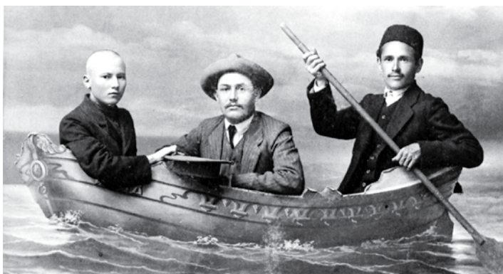
▲ Эстерханда 1911 елның жәендә төшкән фоторәсемдә Габдулла Тукай, Сәгыйть Рәмиев, Шаһит Гайфи. Тукай Эстерханга баргач, Шаһит Гайфи анда аның яшәешен кайгыртучы була. Тукайны күп тапкырлар кымыз эчәргә алып баралар. Эстерханда Тукай шифаханә шартларында яши.