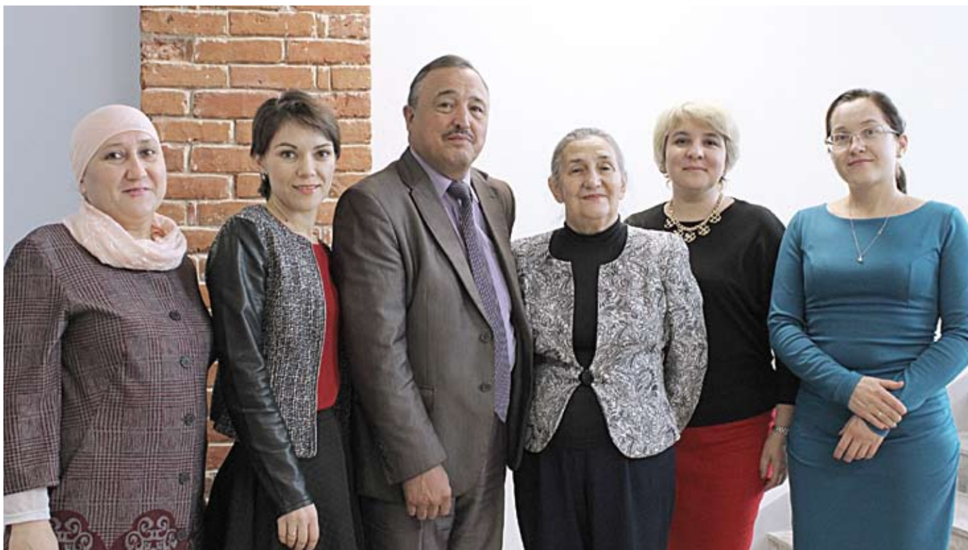
• КФУ Журналистика һәм медиакоммуникация югары мәктәбенең татар журналистикасы кафедрасы.