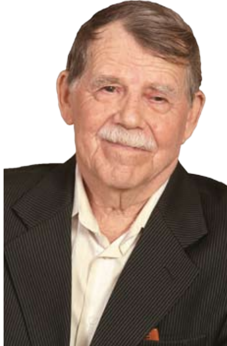
• Фото герой архивынан

– Милләт белән телне аерырга ярмый: татар милләте, аның тарихы, киләчәге турында сөйләшәбез икән, ул телдән аерылгысыз булырга тиеш. Тел турында сүз алып барабыз икән, беренче чиратта, телнең үзен өйрәнү, икенче мәсьәлә – ул телне куллану, өченчәсе – укыту мәсьәләсе булырга тиеш. Әйтик, японнар телне тел дип 5нче сыйныфтан соң өйрәнмиләр, аннары телне куллану өйрәтелә. Ә безнең 11 класска кадәр «тәмамлык», «ия» дип тукуыла, югары уку йортына килгәч тә шул ук эш дәвам итә. Сөйләм, сөйләмиәт фәне, телне куллану – мәктәп тә, югары уку йортлары да менә нәрсә белән шөгыйльләнергә тиеш.